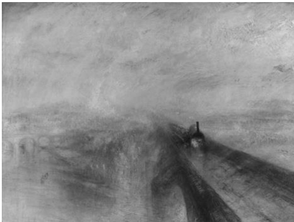
Уильям Тёрнер. Дождь, пар и скорость, 1844 г.

Прежде чем приступить к написанию текста, обратите внимание на критерии, приведённые после иллюстративного материала.