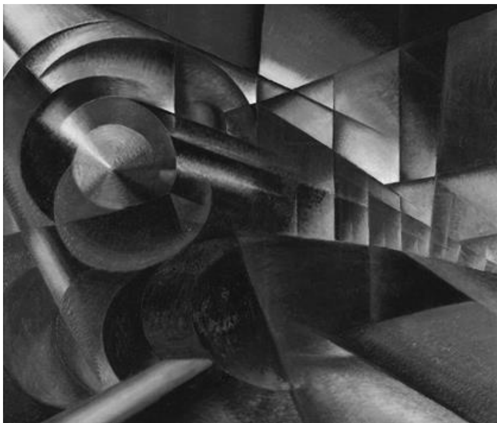
Иво Паннаджи. Ускоряющийся поезд, 1922 г.